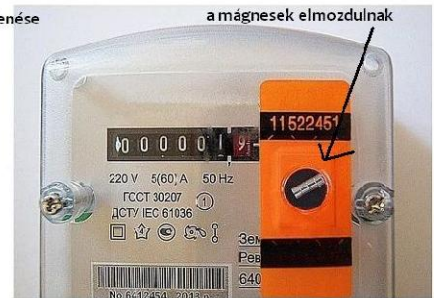
mágneses manipuláció utáni állapot